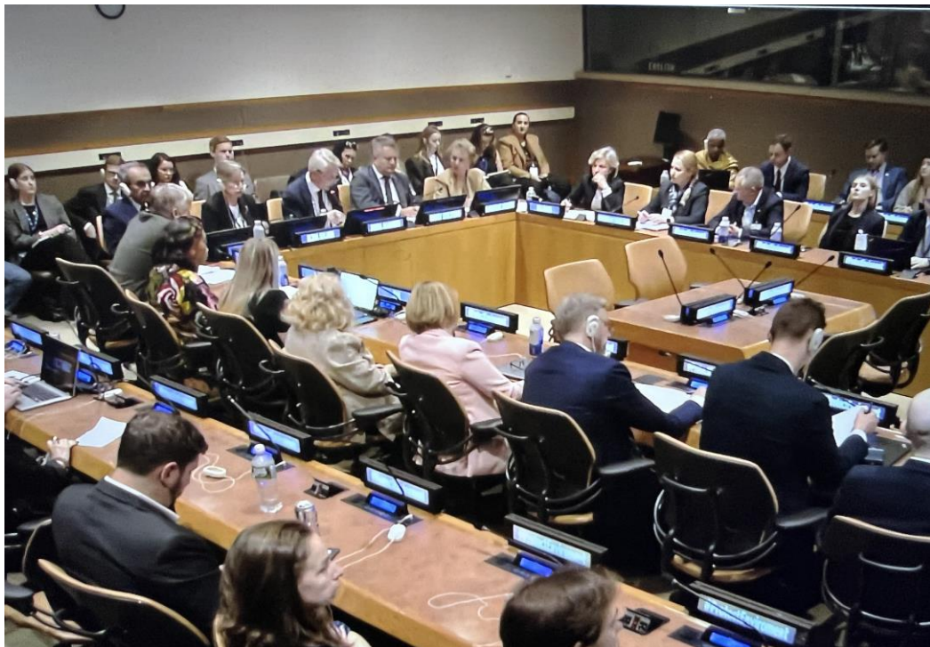
Конференц-зала штаб-квартири ООН